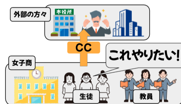
生徒・教職員の「やりたい」を叶える