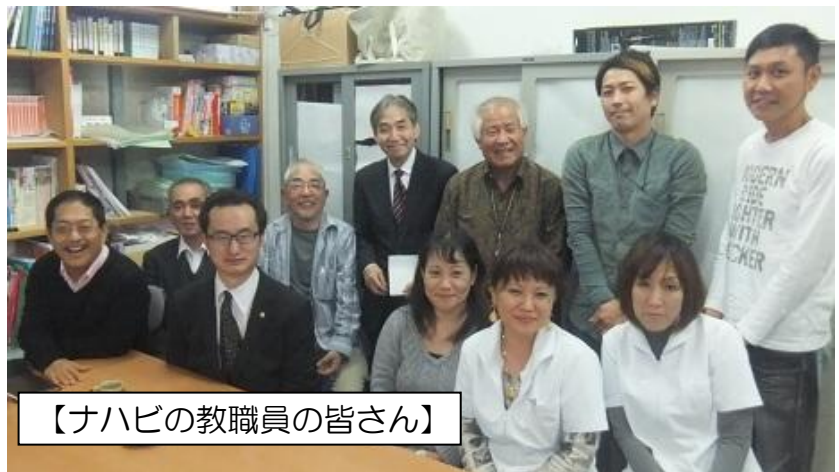
【ナハビの教職員の皆さん】

近隣の在校生の方で興味がある場合、各担任にご相談下さい。（別途費用がかかります。）