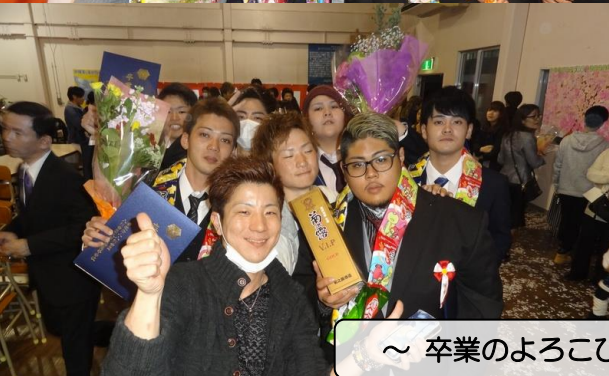
～ 卒業のよろこび ～