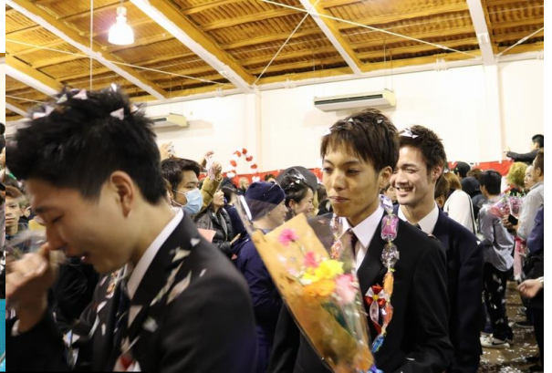
花道（卒業生再入場）