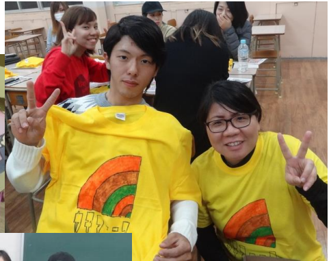
チームTシャツ完成！