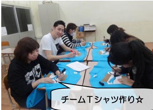
チームTシャツ作り☆