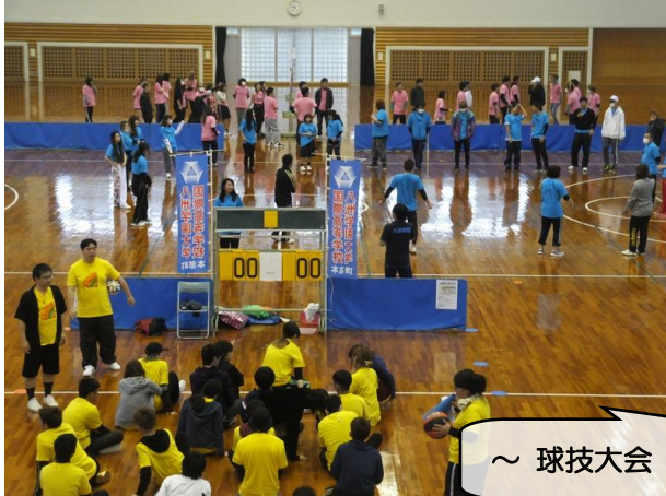
～ 球技大会 ～