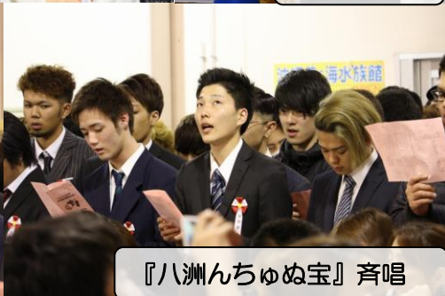
『八洲んちゆぬ宝』斉唱