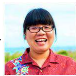
芸能スポーツ／海外（島袋）クラス

みなさん、こんにちは。沖縄は青い空と青い海が輝く季節になりました。前期ネット試験に向けてまだレポート、視聴報告書の提出が残っている方は急ぎ、すすめていきましょう！ 平安山の最近のおススメはハチミツレモンです。レモンを薄くスライスしたものに砂糖とハチミツをつけておくだけで、日焼けをした時期に心と身体のリフレッシュにお勧めです(^_-)-☆サラダのドレッシングの代わりにもなりますよ！ぜひ、お試しあれ。