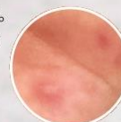
感染してから数日後に2～3mmの水疱(発しん)がみられます。

手足や口の中などに水疱を伴う複数の発しんが出る感染症です。発熱は発症した人の約3分の1で起こり、38度以下のことがほとんどです。多くの場合、数日間で自然に治りますが、まれに合併症を起こし、重症化することがあります。