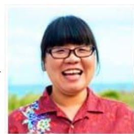
芸能スポーツ/海外 (島袋)クラス

残暑が厳しいながらもなんとなく涼しい風を感じるこの頃、いか かがお過ごしでしょうか。卒業を控えている方は本格的に進路を考 える時期になりました。何かあればぜひ早めの相談をお願いします ね！夏の疲れを癒すにはお酢ドリンクがオススメです。ちなみ に私はざくろ酢ソーダにハマっています。ぜひ、お試しあれ。