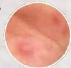
感染してから数日後に2～3mmの水疱(発しん)がみられます。

手足や口の中などに水疱を伴う複数の発しんが出る感染症です。発熱は発症した人の約3分の1で起こり、38度以下のことがほとんどです。多くの場合、数日間で自然に治りますが、まれに合併症を起こし、重症化することがあります。