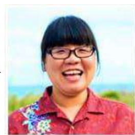
芸能スポーツ/海外 (島袋)クラス

残暑が厳しいながらもなんとなく涼しい風を感じるこの頃、いか かがお過ごしでしょうか。卒業を控えている方は本格的に進路を考 える時期になりました。何かあればぜひ早めの相談をお願いします すね！夏の疲れを癒すにはお酢ドリンクがオススメです。ちなみ に私はざくろ酢ソーダにハマっています。ぜひ、お試しあれ。