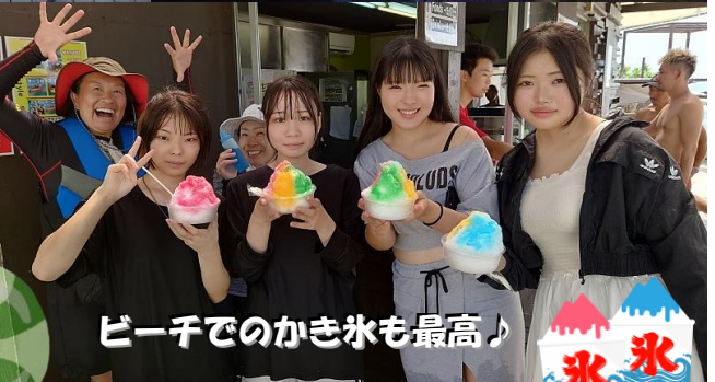
ビーチでのかき氷も最高♪