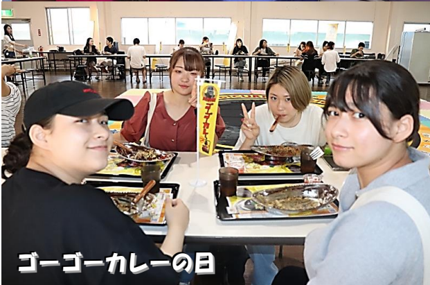
ゴーゴーカレーの日