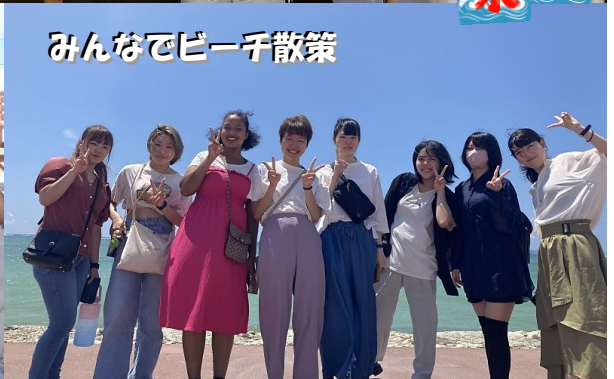
みんなでビーチ散歩