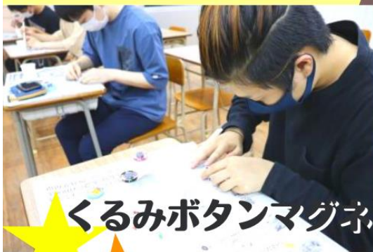
くるみボタンマグネット作成