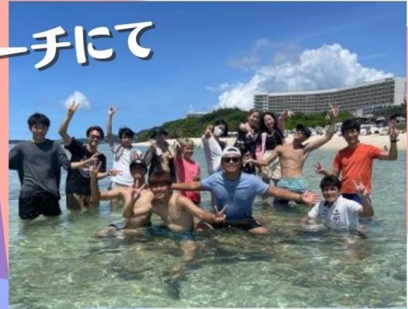
コーラルビュー クルージング