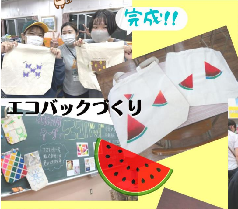
エコバックづくり