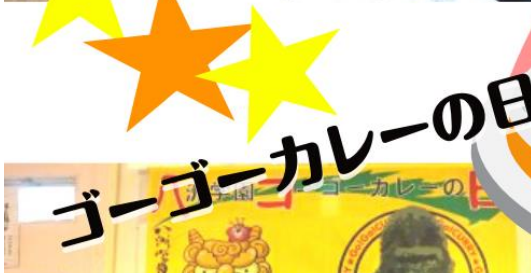
ゴーゴーカレーの日