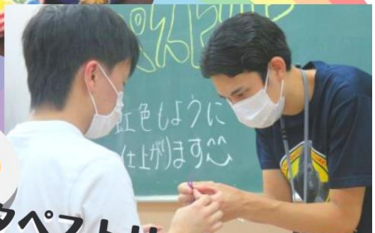
テープストーリー作成