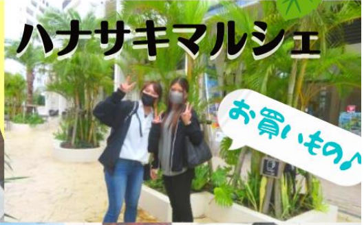
ハナサキマルシェ