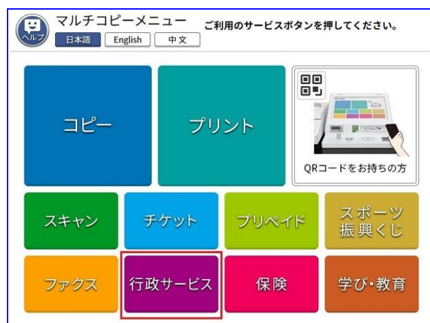
(例)セブンイレブン キオスク端末画面

※注意事項：海外用接種証明書は、自治体窓口かアプリで事前手続きしてあれば発行可能