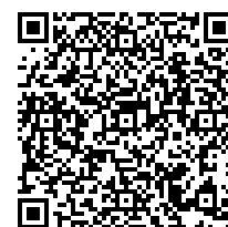
Android 版 (Google Play) 新型コロナワクチン接種証明書アプリ