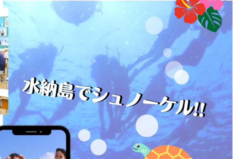
水納島でシュノーケル!!